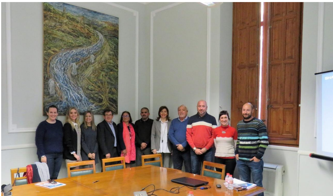
Firma de la renovación del convenio con la Asociación Dar Al Karama en la Diputación

El pasado marzo 2019 se firmó la renovación del convenio establecido con Diputación de la asociación DAR AL KARAMA , en colaboración con otras entidades, para las revisiones oftalmológicas a la población saharauí. Este convenio data del año 2009.