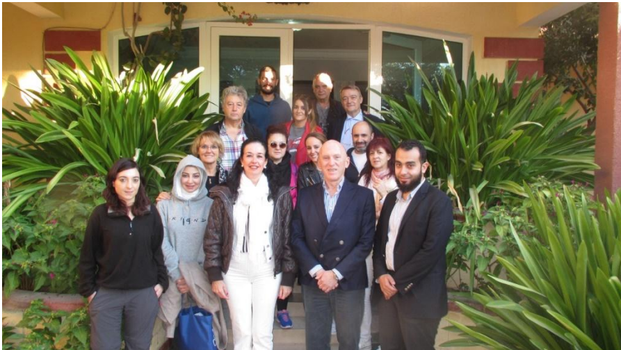
Los miembros de la 14 a expedición

Esta nueva expedición se ha podido llevar a cabo gracias a las generosas donaciones de nuestros benefactores , al apoyo de importantes entidades como la Fundación Seur y la Naviera Boluda que colaboran con nosotros desde los inicios del proyecto con la logística y fletamiento gratuito de los contenedores necesarios para el transporte marítimo y a las donaciones de material sanitario y quirúrgico de parte de notables empresas de la industria del sector oftalmológico y farmacéuticas.