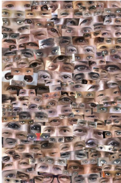
"Miradas de mi mundo" (2018)

Este pasado año 2019 se han recibido las siguientes donaciones de obras que entran a formar parte del patrimonio artístico de la fundación: