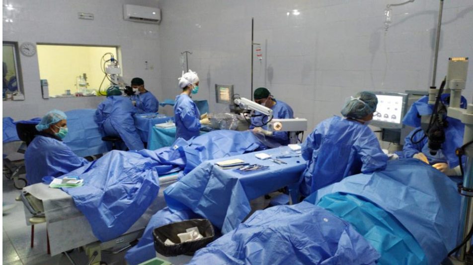
3 cirugías simultáneas