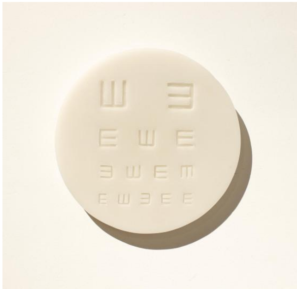
"ALTAIR X" (2017)