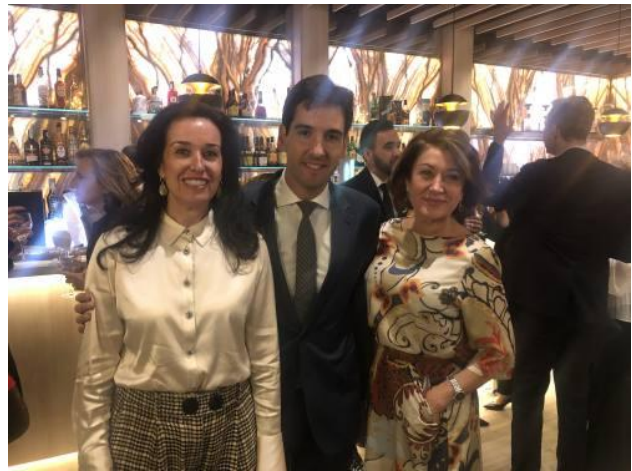
-Inauguración del Bar Bribone. Hotel Meliá Alicante (12 de diciembre)