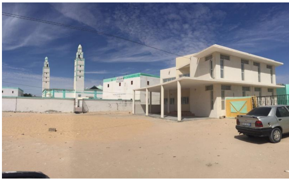
Centro Oftalmológico Hispano Kuwaiti Nouadhibou Visión, Edificio Yacoub Al Nafisi

La Fundación Jorge Alió llevó a cabo su 14ª expedición en las fechas del 1 al 8 de diciembre de 2019 con el fin de avanzar en los objetivos del Proyecto Nouadhibou Visión de mejorar la salud visual de la población de Mauritania y de inaugurar los nuevos quirófanos que se construyeron en el 2018 adyacentes al Centro Oftalmológico Hispano Kuwaiti Nouadhibou Visión, Edificio Yacoub Al Nafisi , construido en el 2017.