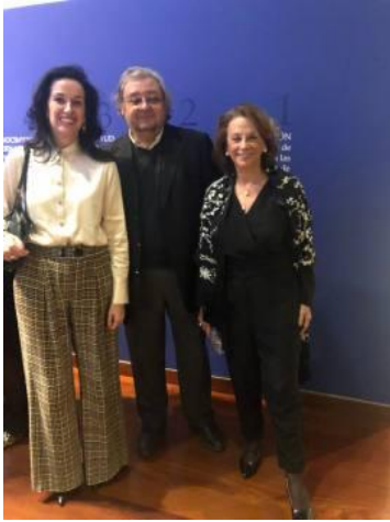
-Inauguración del renovado MUBAG. Museo de Bellas Artes Gravina Alicante (12 de diciembre)