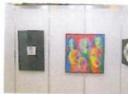
Imagen de la exposición en Milán