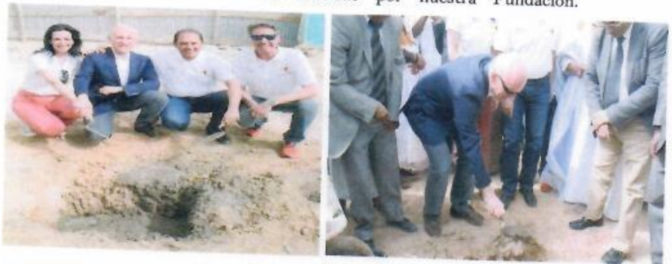
Imágenes de la puesta de la 1ª piedra