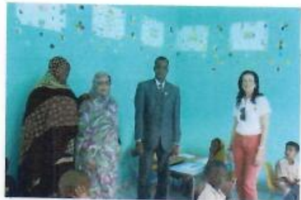
Imágenes visitando a la población y a las escuelas