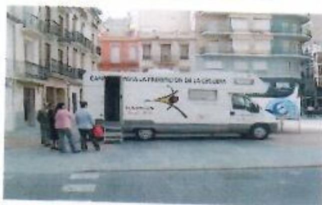
Distintas imágenes de campaña de 3ª Edad y Glaucoma