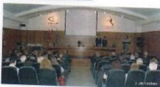
Distintas imágenes del Día de la Paz