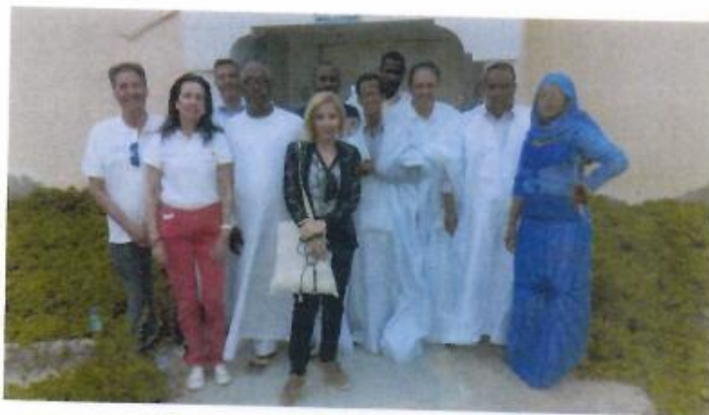
Imagen en la puerta principal de la emisora de radio en Noauadhibou

En concreto fuimos invitados para participar en un programa de radio local con muchísima audiencia.