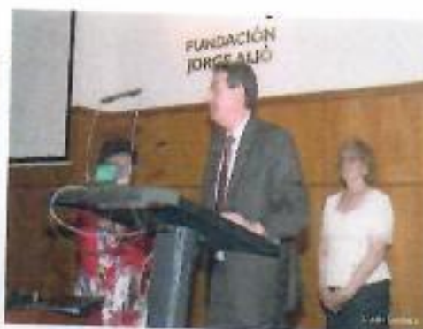
Imágenes del Recital de Primavera