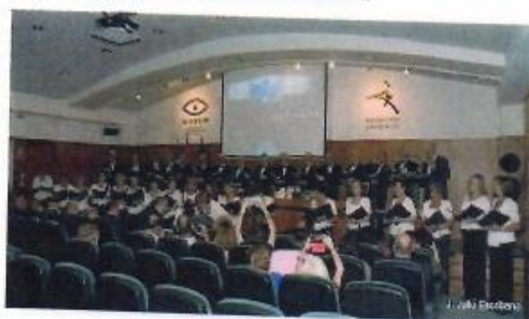
Actuación en el Recital de Primavera