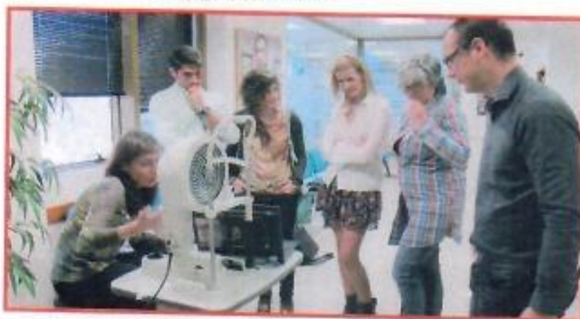
Imagen de talleres

Para el año 2015 no se han desarrollado actividades debido a la situación por la que atraviesan los laboratorios y la industria del sector.