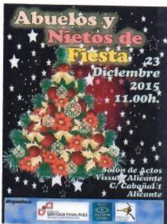
Cartel anunciador del evento