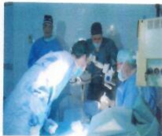
Imagen de cirugía

Dentro de la inauguración se organiza un protocolo para invitar a las autoridades del país.