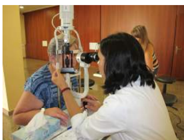
Imagen Campaña de Prevención en Guardamar del Segura

Estas Campañas se iniciaron en Abril del 2012 y la última se ha realizado en Noviembre del 2012. Hemos realizado un total de 3 Campañas de Prevención tercera edad y Glaucoma que suman 602 personas revisadas . El total de pacientes revisados ascienden a 291 en Prevención tercera edad y 311 en Glaucoma .