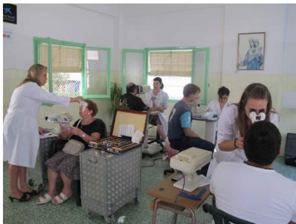
Imagen Campaña Social en ACOMAR

La Fundación Jorge Alió como entidad sin ánimo de lucro y dentro de su objetivo principal “Prevenir la Ceguera” , desarrolla campañas específicas a colectivos con características y necesidades especiales que realizan cada vez más nuestra labor social.