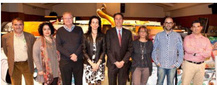
miembros del jurado

Se recibieron un total de 212 obras, de entre las cuales se seleccionaron treinta y dos, cuatro fueron premiadas, y se otorgaron dos menciones honoríficas, y el premio a la Mejor trayectoria profesional y artística, que es un premio honorífico fuera del concurso.