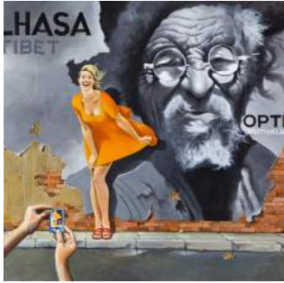
Premio Certamen Internacional de pintura "Miradas de Hispanoamérica" 2012 España "¡Ahora, mira!" José Luis López Saura

Miradas, durante el mes de noviembre, se celebra la V edición del Certamen Internacional de pintura "Miradas de Hispanoamérica". Se presentaron un total de quince obras representando a España, Argentina, México, EE.UU y Venezuela. El jurado decidió otorgarle el galardón a una de las obras presentadas por España.