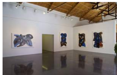
Exposición obras del artista Puigmartí en la Lonja del Pescado