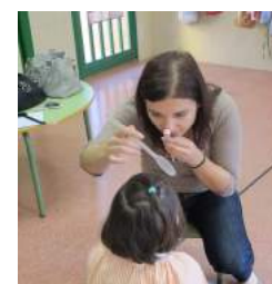
Optometristas realizando la Campaña de Salud Visual Infantil