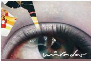
Muestra Artística de la Visión y la Mirada Fundación Jorge Alió para la Prevención de la Ceguera