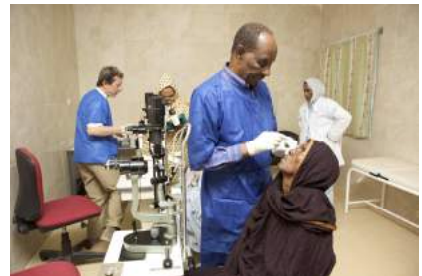
Revisiones postoperatorias en el Centro de Salud nº 2

La última expedición realiza durante del 5 al 11 de noviembre 2012. Este último viaje fue una conjugación de relaciones institucionales, apoyo local al proyecto y como no, nuestro trabajo oftalmológico, revisiones clínicas e intervenciones quirúrgicas.