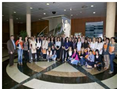
Imágenes X Edición de CUFOCO